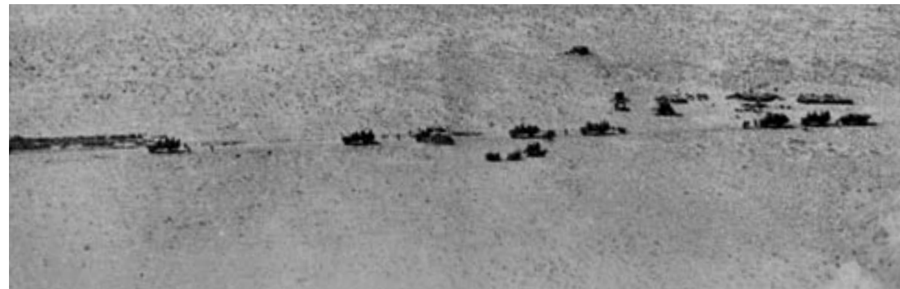
En brittisk kolonn upptäcks av den tyska flygspaningen.

med den under tiden förstärkta stridsmakt som nu kallades den tysk-italienska pansararmén Afrika. Vid el-Alamein , 100 km från Alexandria, var emellertid offensivkraften på upphällningen eftersom tillförseln, som effektivt stördes av de brittiska flygplan som opererade från Malta, bara fick fram allt knappare förråd. – Till Rommels motståndare hade under tiden Bernard Law Montgomery utnämnts, vars 8. armé blev starkare för varje timme, särskilt därför att amerikanska leveranser ostörda ångade fram genom Röda havet och Suezkanalen. Den 23.10 1942 angrep britterna medan Rommel var borta. De hade en nära nog trefaldig överlägsenhet i man och materiel, bröt 2.11 igenom de tysk-italienska linjerna, tog 30 000 fångar och började förfölja de retirerande axeltrupperna. Snart hamnade dessa i en kniptång, eftersom amerikanska trupper inom ramen för operation »Torch« 7–8.11 landsteg i Marocko och Algeriet och ryckte fram mot Tunisien. Rommel, som under tiden återvänt, drog sig tillbaka dit med sin armégrupp Afrika (Tripolis övergavs 23.1 1943) och han kunde räkna in ännu några försvarsframgångar. Efter att Rommel skilts från kommandot i mitten av mars kunde hans efterträdare generalöverste Hans-Jürgen von Arnim ytterligare några veckor hålla det tunisiska brohuvudet,