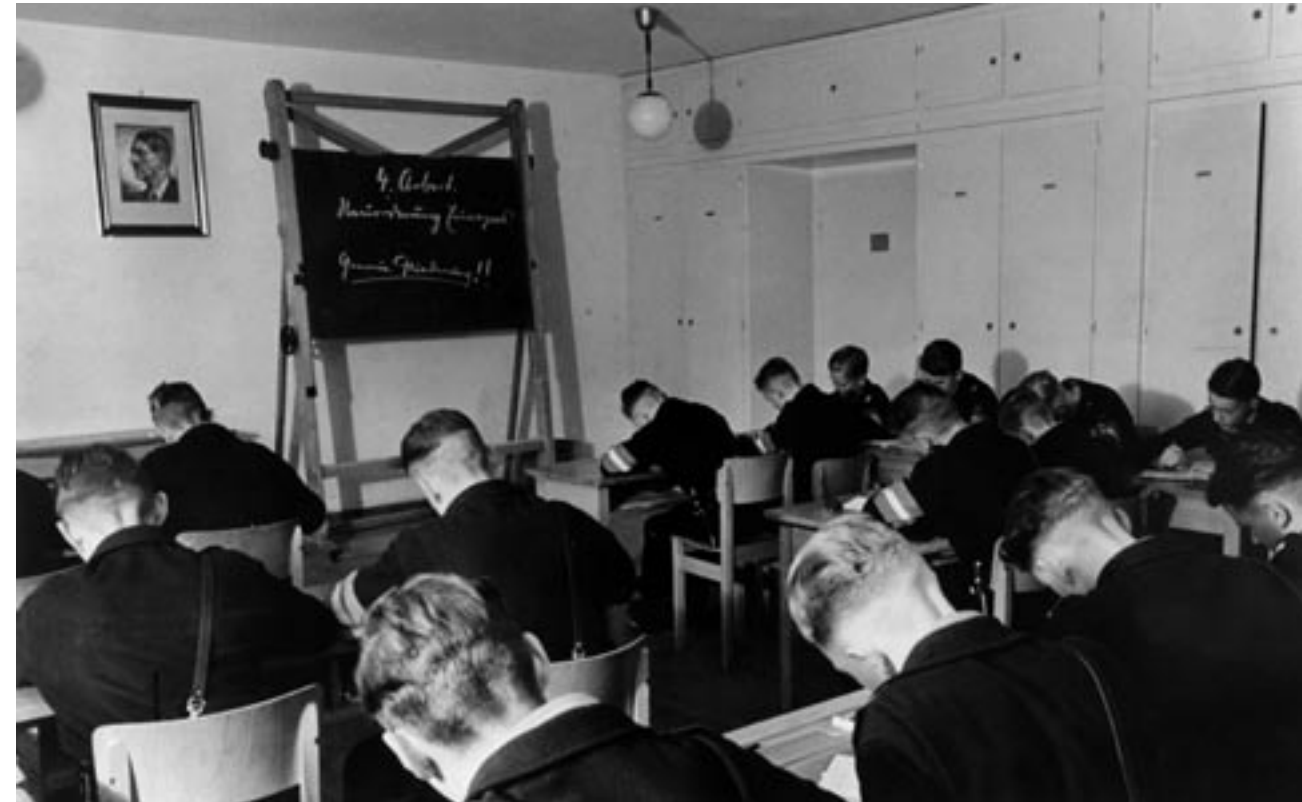
Klassrummen i AH-skolorna saknade kateder och eleverna skulle i hög grad bedriva självstudier.

Adolf Hitler-skolor (AHS) För ungdomen, »framtidsgarantin«, kände sig många ansvariga i Tredje riket: riksungdomsledningen, ministeriet för folkbildning, SS, Deutsche Arbeitsfront (Tyska arbetsfronten) – alla ville de bygga skolor för att utbilda ännu bättre nationalsocialister. Chefen för arbetsfronten, Ley , lyckades 15.1 1937 få Hitlers tillstånd till ett nytt slags skola som skulle bära hans namn. Efter hand tillkom tolv AHS, som de officiellt förkortades. De var internatskolor, finansierade av arbetsfronten, men med kursinnehållet utformat av riksungdomsledningen. De skulle vara förberedande skolor för ordensborgarna och demonstrera »ungdomens eget ansvar också i skolan«. Detta lyckades knappast. Visserligen fick alla lärare och »skolledare« Hitler-Jugend-