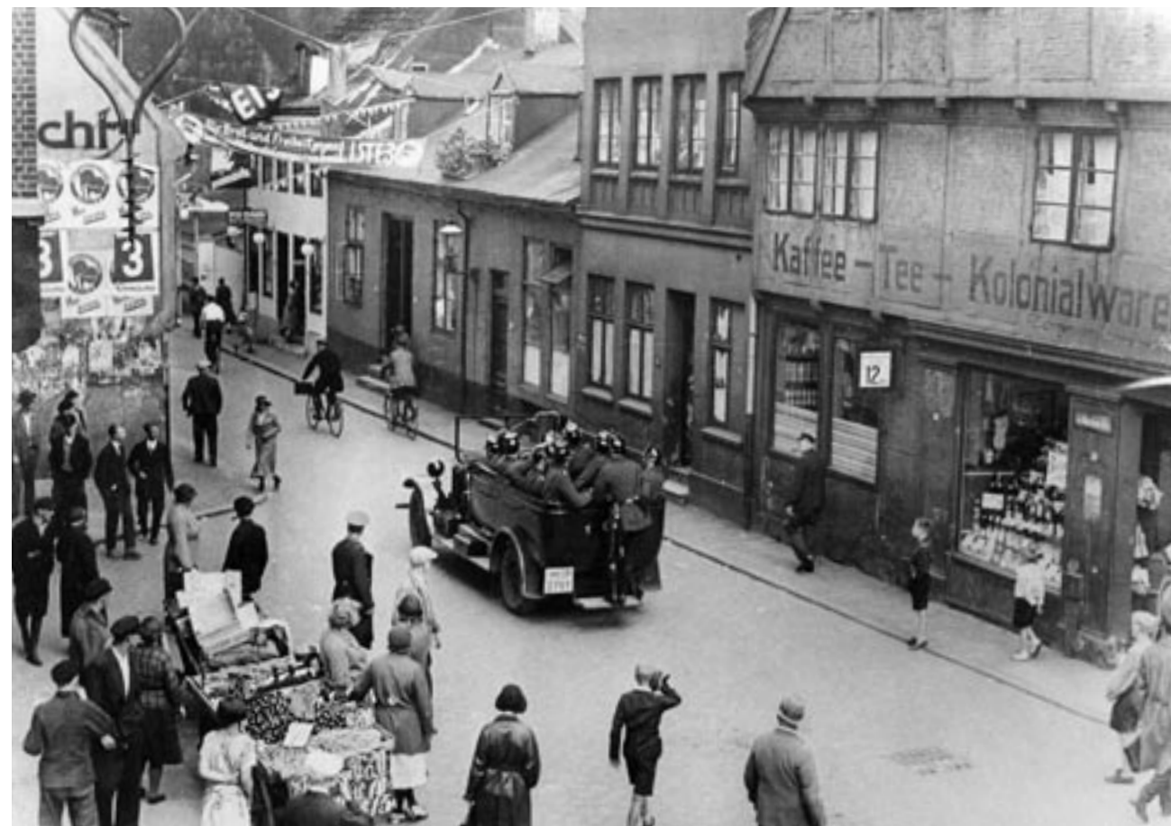
Polispatrull på Altonas gator dagen efter striderna mellan nationalsocialister och kommunister.

Altonas blodiga söndag (ALTONAER BLUTSONNTAG) Nationalsocialisterna provocerade gärna sina motståndare där de var som starkast. De hoppades att med gatustrider locka fram en känsla av rättsosäkerhet som fick ropen på en stark man (= Hitler) att ljuda allt högre. En elakartad höjdpunkt nådde denna strategi 17.7 1932 då ca 7 000 SA- och SS-män med den socialdemokratiska polisledningens tillstånd marscherade genom de kommunistiska arbetarkvarteren i Altona (som på den tiden ännu hörde till Preussen och införlivades med Hamburg först 1937). Precis som de hoppats blev de angräpnade och en massiv polisstyrka måste sättas in. Detta blev »den blodiga söndagen« som Papen -regeringen tog till förevändning för Preussenslaget : 18 människor, däribland två SA-män, föll offer framför allt för missriktade poliskulor. Polisen