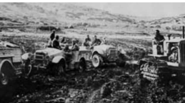
Italienska förband körde fast, både i leran och mot fienden.

Afrikafältåget När Italien gick in i kriget på Tysklands sida 10.6 1940 fanns det i den italienska kolonin Libyen en italiensk armégrupp på totalt 153 000 man. De förfogade över 339 lätta pansarvagnar, 1 441 kanoner, 135 jaktplan, 110 bombplan och 45 attackplan. Även om utrustningen delvis var föråldrad trodde sig Mussolini ha goda chanser mot de svaga brittiska stridskrafterna i Egypten (31 000 man), och han inledde 13.9 1940 utan konsultationer med Berlin sitt »parallellkrig« i Nordafrika. Den italienska offensiven över den libysk-egyptiska gränsen körde fast redan 19.9 efter erövringen av Sidi Barrani. I början av december 1940 gick brit-