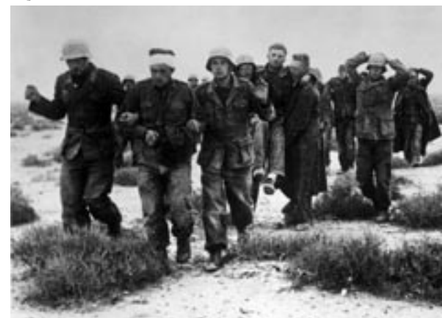
Soldater ur den tyska Afrikakåren kapitulerar i Tobruk, april 1941.

som Hitler beordrat honom att inte utrymma, men 13.5 1943 måste han kapitulera; 157 000 tyska och 86 700 italienska soldater gick i krigsfångenskap. – Afrikafältågets facit var 18 594 stupade och 3 400 saknade tyskar, 13 748 stupade och 8 821 saknade italienare, samt 47 580 stupade och 24 134 saknade allierade soldater. De materiella förlusterna för axelmakterna hade nått svindlande höjder. I trafiken på Libyen gick 36 % av skeppstonnaget till spillo och i den på Tunisien hela 57 %.