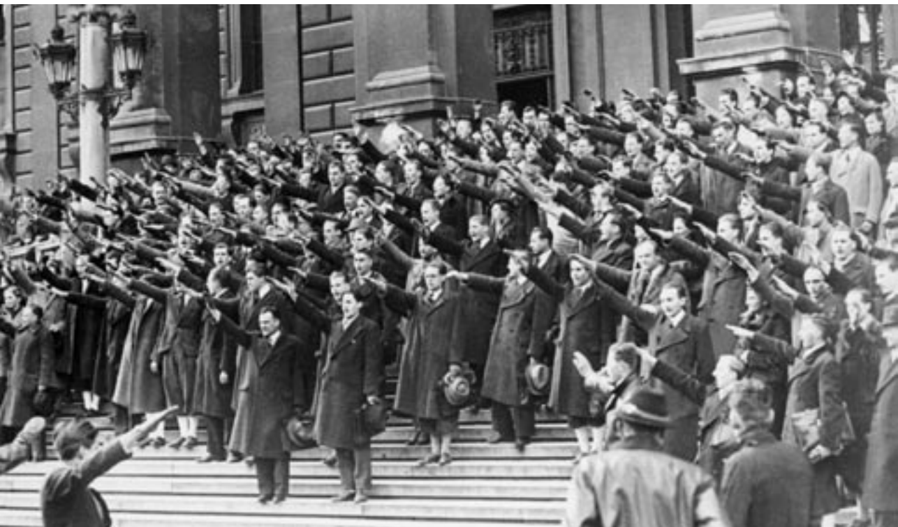
Studenter utanför Wiens universitet, 15.3 1938.

visste att ärligheten i hans ständiga försäkringar om fredliga avsikter skulle bedömas efter vad han gjorde med Österrike i anslutningsfrågan. Den tyska pressen instruerades (30.6 1933) att avstå från att nämna ordet »Anschluss«. Detta ändrade förstas ingenting i det krav som restes redan i Mein Kampf : »Det tyska Österrike måste tillbaka till sitt tyska moderland.« Och Hitler var ingalunda så överraskad som han påstod, när de österrikiska NSDAP-anhängarna misslyckades med sin kupp mot Dollfuss 25.7 1934. Redan med hänsyn till Italiens hotfulla attityd (trupper sändes upp i Brennerpasset) måste Hitler spela oskyldig. – Han förstod att nyckeln till anslutningen låg i Rom och började uppvakta Mussolini . Med Abessinien -krisen vann han sådan framgång att Wienregeringen under Schuschnigg måste göra medgivanden till Hitler i julöverenskommelsen 1936. De infriades bara